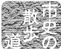
五里ごり館 (歴史民俗資料館) ☎(55) 7611 No.280