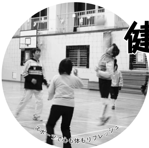
スポーツで心も体もリフレッシュ