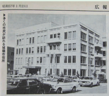
昭和57年当時の市役所庁舎