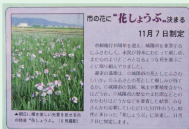
市制施行10周年記念号はカラーでした