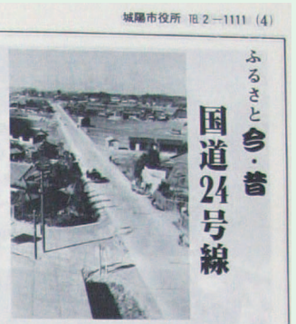
昭和57年の紙面で発見。29年ごろ撮影された、現在の市役所付近の府道(旧国道) 国道24号線