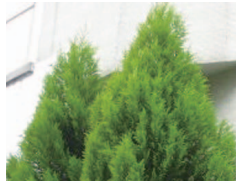
▲ゴールドクレスト

コニファー類を一定の大きさに保つためには、年に1回剪定する必要があります。今回はコニファー類の剪定方法について紹介します。