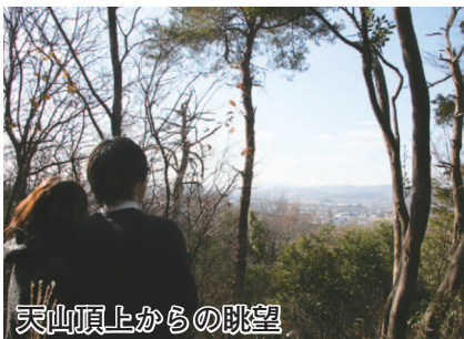
天山頂上からの眺望

【売店】 期間中毎日10:00~15:00 (天候により変更あり)おでん、うどん、梅おにぎり、カレー、フランクフルト、炊き込みご飯(土・日曜日)、梅製品、梅干し、梅シャーベット、青谷梅福もち(土曜日)、和菓子、ギフトセット、飲み物など