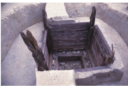
▲下水主遺跡出土の井戸 (平安時代)

いた島のように見えます。現在でもこの地域では島畑が各所で残っており、特に特産物の一つであるイチジクが栽培されている風景をよく目にすることができます。発掘された島畑は土層から、3回程度土盛がされていて、最下層から出土した土師器(はじき)・瓦器などから、13世紀前半から形成されていたことが明らかになりました。また、島畑の位置は現在の水田区画と合致していることがわかりました。