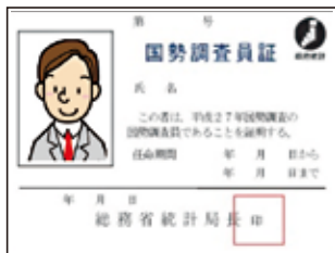
▲国勢調査員証見本