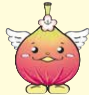
城陽イメージキャラクター 「じょうりんちゃん」