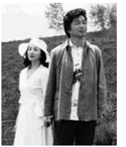
中村雅俊・原田美枝子

「60歳のラブレター」 日程 11月21日(土)10:30・14:00/プラムホール ※料金はお問い合わせください