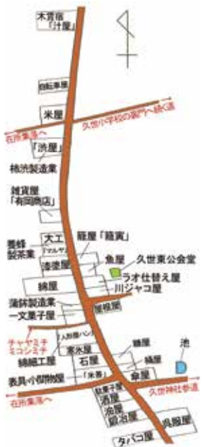
▲大正期から昭和初期にかけての久世の街道集落の店

大正期から昭和初期にかけての久世の街道集落の店... 養蜂と製茶業の「マルヤ」が、その街道の東側には、キセルの修理と清掃をするラオ仕替え屋、巨椋池のジャコを仕入れていた川ジャコ屋、漬物や飼料などを扱っていた糠屋、借家と質屋も兼ねた呉服屋などがありました。