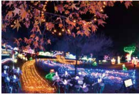
▲キラキラと輝くイルミネーション

約60万球のイルミネーションが夜空を彩る光の祭典 問 観光協会 ☎(56)4029 7万球からスタートしたこのイベントも、今や京都を代表する冬の風物詩として、市内外から約20万人の来場者が訪れるイベントになりました。 主会場では、市民や地元企業などによるデザイン出展に加え、さまざまなイベントや地元物産の販売などを行います。