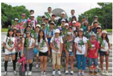
▶献花をする派遣団

市では、さらに、未来を担う子どもたちに戦争の悲惨さを伝えるため、「平和のための小中学生広島派遣団」事業を行っています。派遣団は、原爆が投下された広島を実際に訪れ、戦争について学習し理解を深めます。