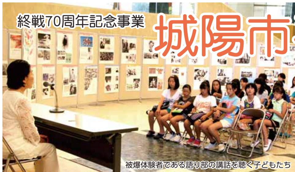
被爆体験者である語り部の講話を聴く子どもたち

平成7年から開催している「平和のつどい」。終戦70周年の節目の年である今年には、五里ごり館(歴史民俗資料館)が保存している戦時中の写真や資料を展示します。また、図書館では、戦争や平和についての図書コーナーも設置します。今号では、平和のつどいのご案内とともに、市が進める平和への取り組みをご紹介します。みなさんも今一度平和の大切さについて考えてみませんか。