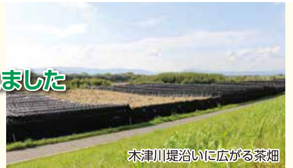
木津川堤沿いに広がる茶畑

中でも城陽の茶園は木津川河川敷に、伝統的な本ずや、寒冷紗による覆下栽培、集落内には茶工場が点在し、自然と生業、生活が密接に関連する景観を形成しています。城陽は現在でも「てん茶(抹茶)」の産地として知られ、19世紀以降、河川敷の平坦な砂地を利用して覆下栽培により生産されるお茶は、松のような濃い緑をもつ独特のお茶となります。