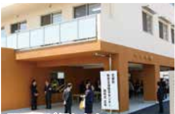
開所式が行われた 「京都府聴覚言語障害センター」

市のばれっとJOYO(男女共同参画支援センター)北側に、京都府情報コミュニケーションプラザが設置され、その中に、府下初となる聴覚言語障がい者情報提供施設「京都府聴覚言語障害センター」が開所しました。