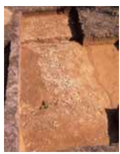
▲今回の発掘調査で見つかった古墳の造り出しと埴輪列

明治27年に発見された南山城最大の久津川車塚古墳からは、長持形石棺とともに銅鏡や刀剣・甲冑、装身具など多くの副葬品が見つかりました。それらはとても貴重な文化財で、現在は京都大学や東京国立博物館などで大切に保管され