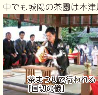
茶まつりで行われる「口切の儀」

お茶が中国から日本に伝えられて以降、京都・山城地域は、お茶の生産技術を向上させ、「抹茶」、「煎茶」、「玉露」を生み出し、約800年にわたり最高級の多種多様なお茶を作り続けてきました。この地域は、我が国の喫茶文化を、生産・製茶面からリードし、発展に貢献した歴史があります。また、その発展段階ごとの景観を残しつつ今に伝える独特で美しい茶畑、茶問屋、茶まつりなどが優良な状態で揃って残っている唯一の場所です。