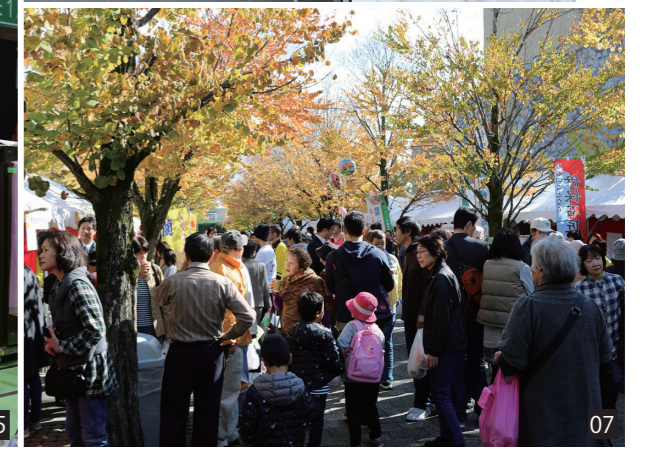
01 金銀糸 02 金銀糸工場 03 酒蔵 04 酒の仕込み 05 LED製品の工場 06 山背彩りの市 07 JOYO産業まつり