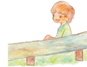
鴻ノ巣山運動公園 (城陽市総合運動公園)

関西でも屈指の規模の大芝生広場と、地形を生かした約140メートルのローラーライダーは無料で遊べることもあり、休日は家族連れで大にぎわい。体育館、野球場、テニスコートなどのスポーツ施設もあります。近くにはゴルフ場もあり、スポーツを楽しむ人の笑顔があふれています。鴻ノ巣山の展望台からは、まちを一望できます。