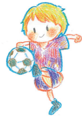
サンガタウン城陽