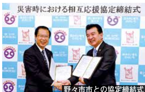
野々市市との協定締結式

6月、市と(株)京都銀行は「地方創生に関する包括連携協定」を締結しました。情報共有や事業連携などを通じ、地域経済の活性化に取り組みます。8月には、情報発信力の強化などで連携するため、京都芸術デザイン専門学校