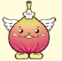
城陽イメージキャラクター 「じょうりんちゃん」