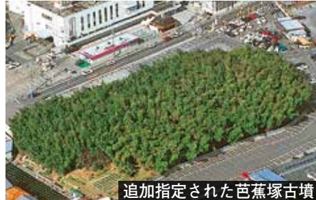
追加指定された芭蕉塚古墳

国の文化審議会の答申があった「芭蕉塚古墳」と「久世小学校古墳」が10月に史跡として、「史跡久津川車塚・丸塚古墳」に追加指定され、「久津川古墳群」に名称変更となりました。芭蕉塚古墳は5世紀中頃に築造された