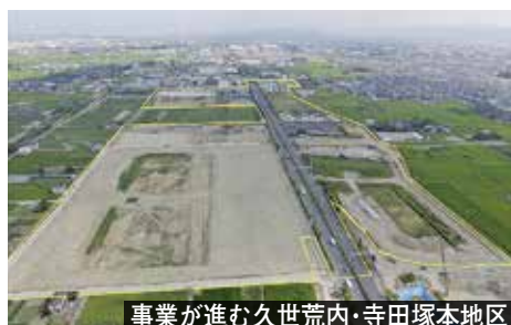
事業が進む久世荒内・寺田塚本地区

市では、新名神高速道路城陽ジャンクション・インターチェンジ(仮称)に隣接する「久世荒内・寺田塚本地区」へ工業・流通系を中心とした企業の誘致を行っています。7月に、日本郵便(株)へ土地の引き渡しを行い、現