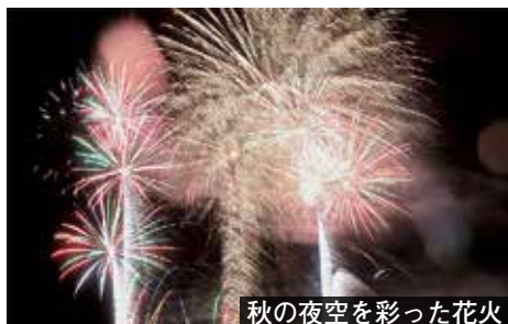
秋の夜空を彩った花火

9月、五里五里の丘(府立木津川運動公園)で4年ぶりとなる「城陽秋花火大会2016」が開催されました。城陽青年会議所が中心となり、市や観光協会、城陽商工会議所などをつくる実行委員会により実施されました。当日はあいにくの天候にもかかわらず、会場には約3,000人が訪れました。ステージでのダンスなどの催しや飲食ブースもあり、フィナーレには約1,000発の花火が打ち上げられ、夜空を彩る大輪の花を楽しめました。