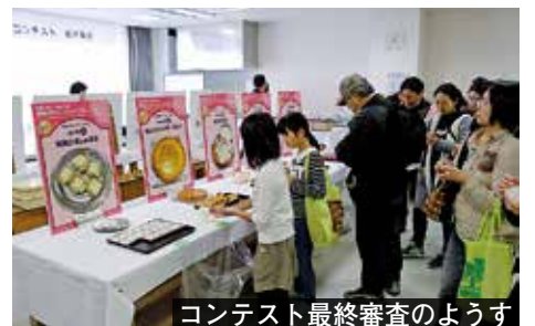
コンテスト最終審査の様子

11月、京都府随一の生産量を誇る青谷梅林で栽培される「城州白」を使用したスイーツコンテストの最終審査が行われました。市内外からプロ部門、一般部門に合わせて27点の応募があり、最終審査にはプロ6点、一般5点が進みました。スイーツ専門家ら特別審査員と産業まつり来場者先着40人が審査を行い、最優秀作品には、プロ部門「うめジェラート」、一般部門「うめこめケーキ」が選ばれました。最優秀賞などの入賞作品は、来年2月下旬から開催される梅まつりでの販売を目指しています。