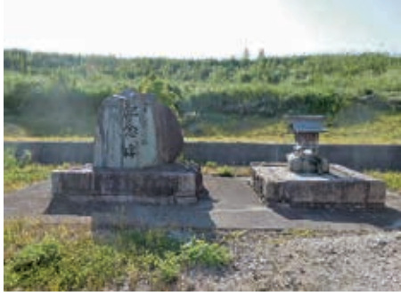
▲生れ口樋門の石碑と淀姫様の祠