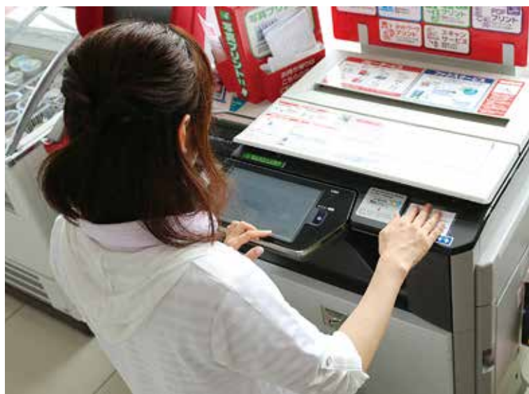
▲マルチコピー機でのコンビニ交付の様子