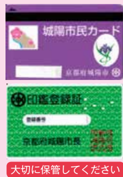
大切に保管してください

なお、城陽市民カード(紫色)と印鑑登録証(緑色)は、8月以降も窓口での印鑑登録証明書取得に必要となりますので、大切に保管してください。