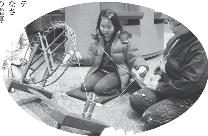
糸紡ぎ体験では、綿から糸になる様子に驚きの表情

体験では、はじめは真剣な表情で恐る恐る回していた児童も、職員のアドバイスで紡いだ糸に触れた感動に驚きの表情。縄ない体験は、「資料館友の会ボランティア」のみならずが児童への指導にあたり、その鮮やかな手さばきに児童のまなざしが集中。はじめてわらに触れた児童も、戸惑いながらもコツがつかめる