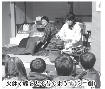
火鉢で暖をとる昔のようす(ミニ劇)

五里こり館(歴史民俗資料館)で行われている「昔のくらし」体験授業。小学3年生の社会科のテーマでもあります。今号では、地域の人々が受け継いできた文化やくらしを、今池小学校の児童たちが体験した様子をご紹介します。