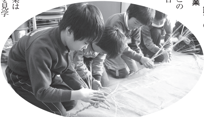
真剣な表情で縄ない体験

するといっただけではなく、生活様式の昔と今の違いをクイズにしたり、ミニ劇で家庭の様子を紹介したり、さらに実際に昔使っていた道具で「糸紡ぎ」や、わらから縄をつくる「縄ない」の体験も取り入れた盛りだくさんの内容です。