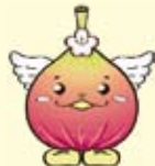
城陽イメージキャラクター 「じょうりんちゃん」