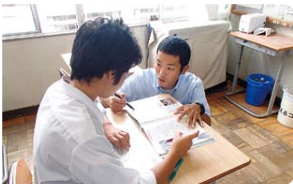
▲教育充実補助員の活動