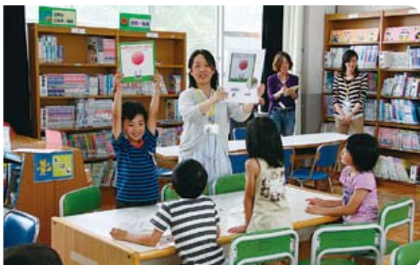
▲本を見つけて発表する「図書館利用指導」の学習

親は常に子どもの成長を願うもの。その思いを受け止めて、教育の現場では、子どもの心と体をバランスよく鍛えられるよう授業に工夫を凝らすほか、未来を担う次世代の人材育成に向けて、地域も交えたさまざまな取り組みを進めています。今号では、新たに充実した主な施策について紹介します。