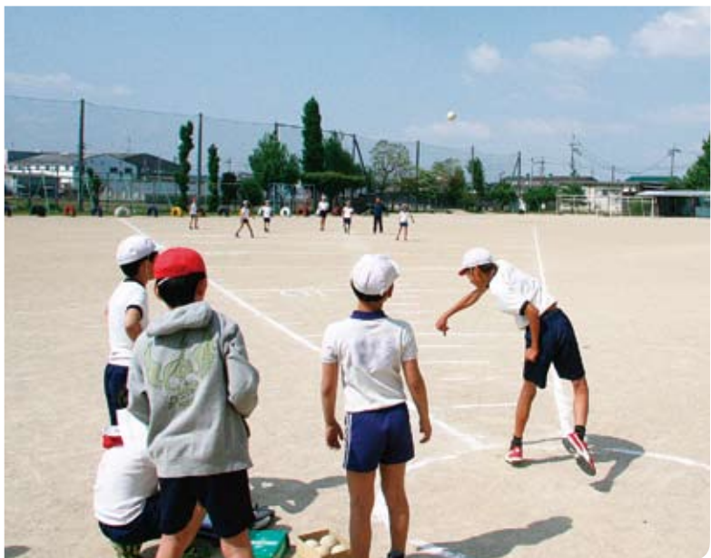
▲土曜活用を利用した体力テスト