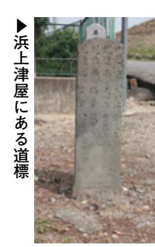
浜上津屋にある道標

上津屋村は現在、行政地区が城陽市、八幡市にわかれていますが、江戸時代、上津屋村は中央を流れる木津川によって東西に分断され、川の西側の南に浜方、北側に里方、川の東側に東向(ひがしむかい)があり、明治22年(1889年)まで、上津屋村は「川越東八長池宇治道」「堤通南八天神森奈良道」「堤内西八楠葉枚方道」「堤通北八よど八幡道」といった文字が刻まれています。文面の「川越」という文字が、かつてここに渡しがあったことを示す手がかりです。この道標からも上津屋は人々が集まる場所、交通量が多かったことを示しています。ご紹介したこの道標についても展覧会で取り上げますので、ぜひご覧ください。