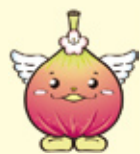
城陽イメージキャラクター 「じょうりんちゃん」