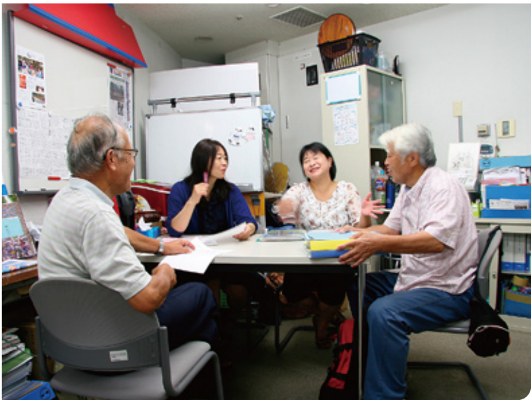
▲市民活動支援センターの様子

市では今、「市民が主役、あなたの活動を積極的に支援します」を基本政策のひとつとして、市民活動の支援に取り組んでいます。そのひとつが、「市民活動支援センター」です。今号では、その活動内容やこれまでの成果などについてお知らせします。