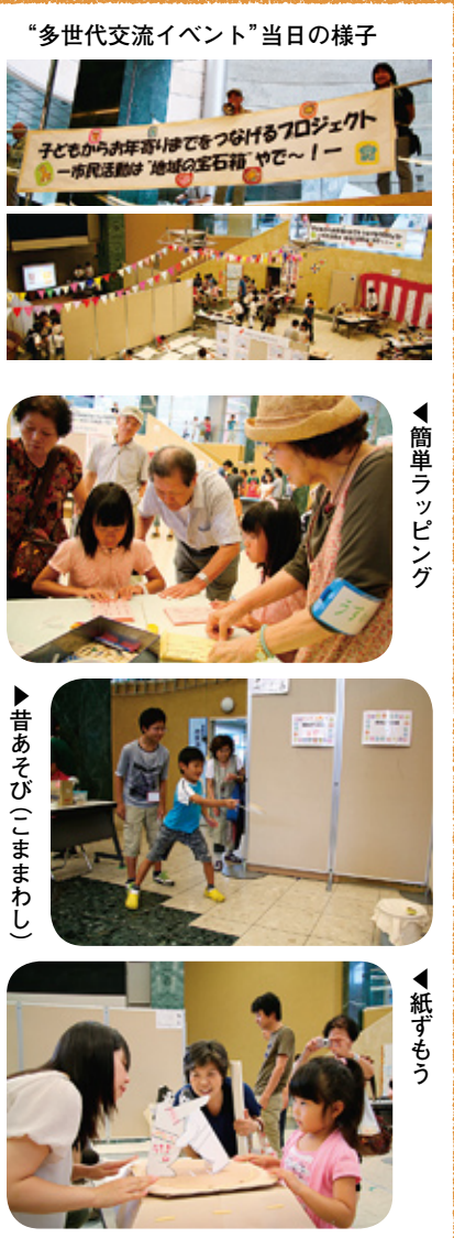
“多世代交流イベント”当日の様子

り事業の創設を目指しており、そのための情報交換の場として「まちの木サロン」を昨年4月から毎月1回開催し、登録団体のメンバーや多くの市民が集い、団体の垣根を越えた幅広い議論が行なわれています。そのメンバーが中心となって、去る8月2日の土曜日に、「多世代交流イベント」が文化パルク城陽で開催されました。これは、子育てを地域で支える環境がなくなりつつあり、