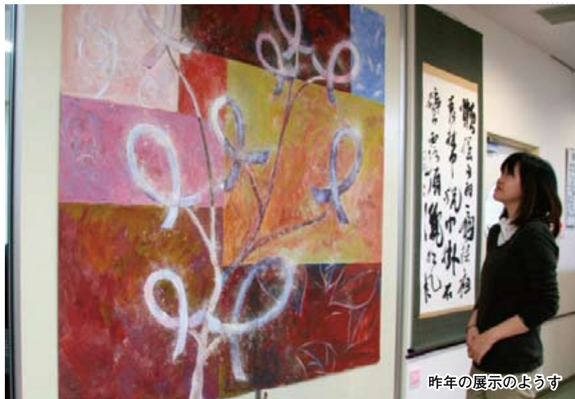
昨年の展示のようす