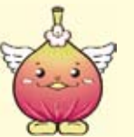
城陽イメージキャラクター 「じょうりんちゃん」