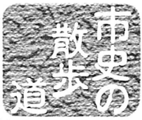
五里館(歴史民俗資料館) (55)7611 No.296

暑い季節、気をつけよう食中毒 生活を見直して、菌に負けない体づくり。暑さが厳しくなると、寝つきが悪くなったり、食欲が落ち、冷たいものばかり飲んで食事をとらなかつたりと、生活のリズムが狂いがちです。抵抗力が落ちてくると食中毒を引き起こすようになります。