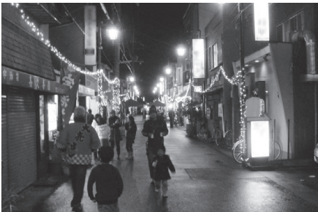
ウィンターフェスタのようす

「山背彩りの市」は、推進員が事務局員として商店街のみならず、ボランティアなど力を合わせ、JR城陽駅前商店街、アクトシティ城陽商店街周辺を会場として開催して