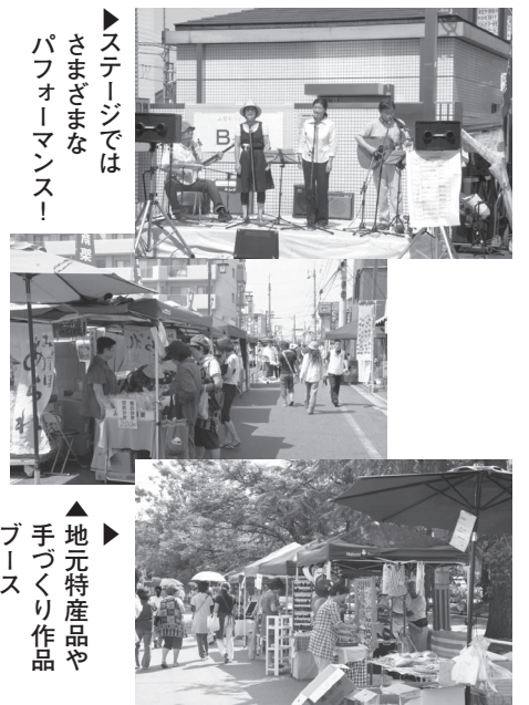
▶ステージではさまざまなおパフォーマンス!