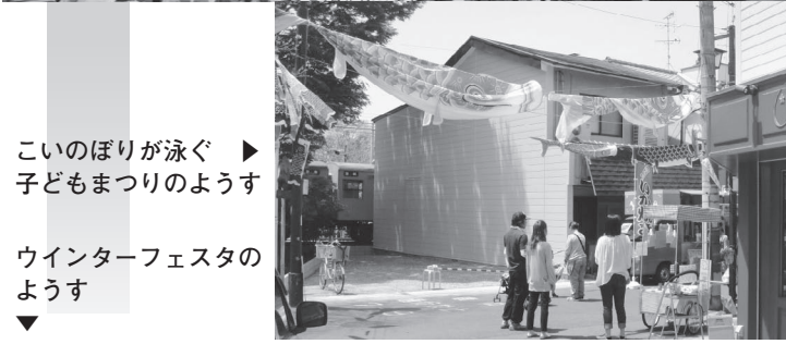
こいのぼりが泳ぐ子どもまつりのようす