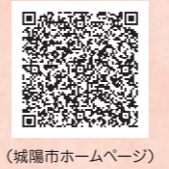
(城陽市ホームページ)

発行: 城陽市 農政課・商工観光課 ☎0774-56-4005・4018 http://www.city.joyo.kyoto.jp 協力: 京都やましろ農業協同組合 城陽支店・城陽南支店・城陽商工会議所、(一社) 城陽市観光協会