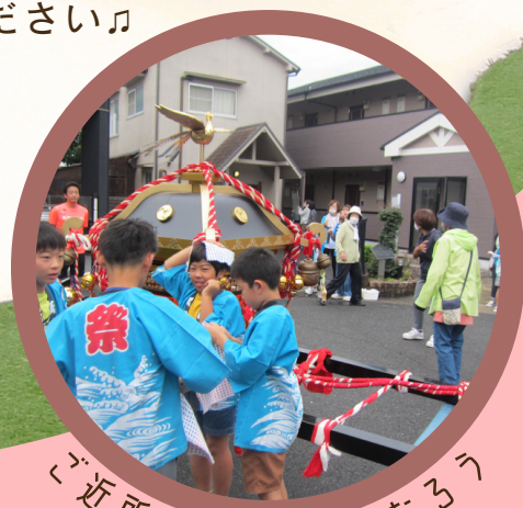
ご近所さんと仲良くなろう