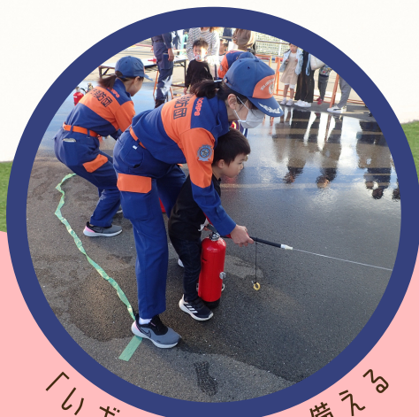
「いざという時」に備える