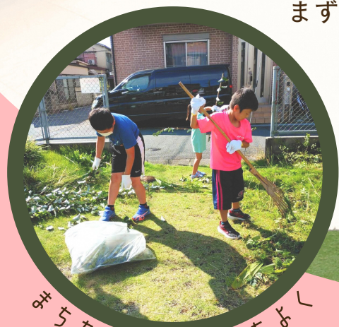
まちをキレイに気持ちよく

いざという時のために、 「互近助（ごきんじょ）」活動、してみませんか。 まずは市民活動支援課にお越しください!