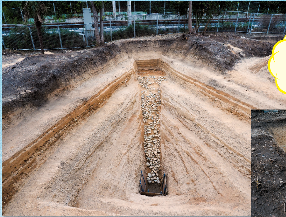
久津川車塚古墳後円部下段出土状況