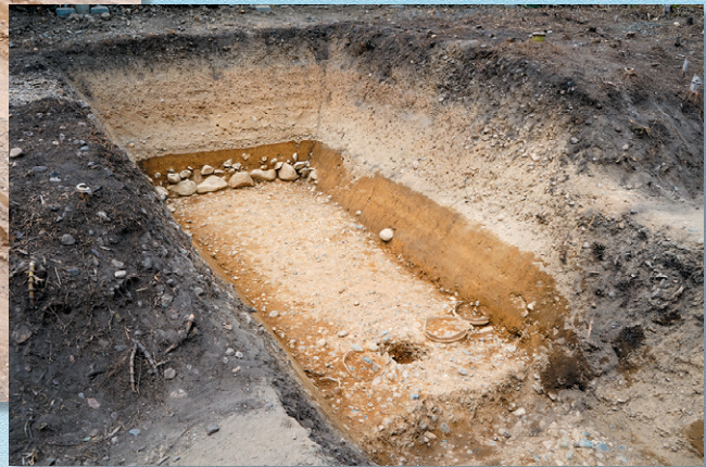
久津川車塚古墳後円部下段出土状況

発掘調査速報展では 久津川車塚古墳や芭蕉塚古墳、 芝山古墳群の発掘調査成果を ご紹介します!