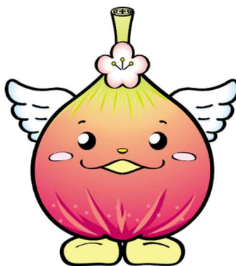
じょうりんちゃん