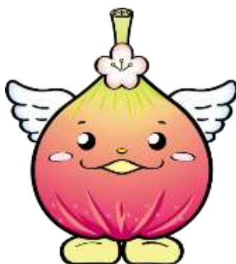
じょうりんちゃん