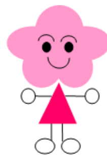
城陽環境啓発キャラクター ウメっち