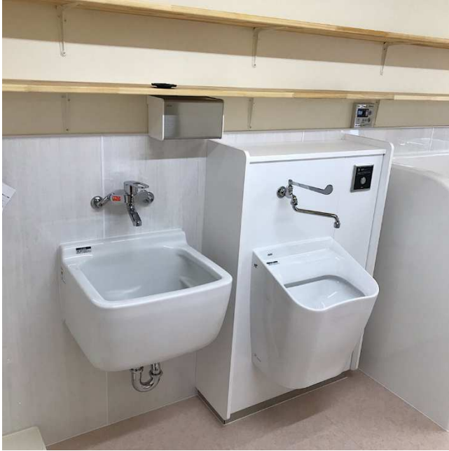
⑬トイレ（汚物流し、多目的流し）