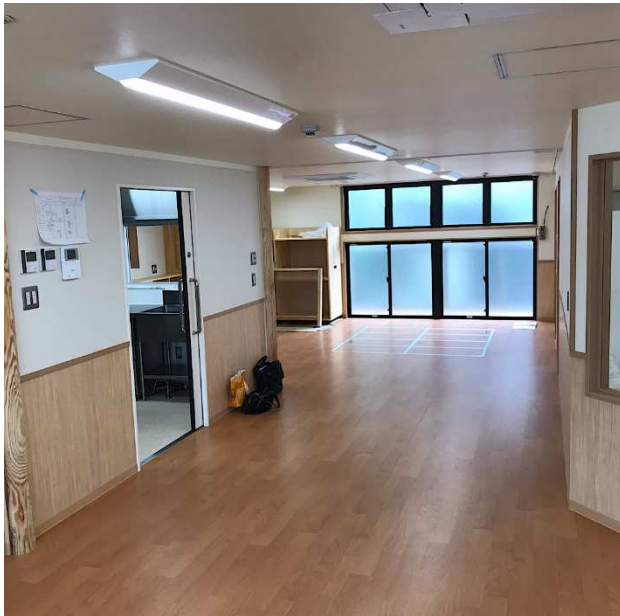
⑤保育室北側から南側