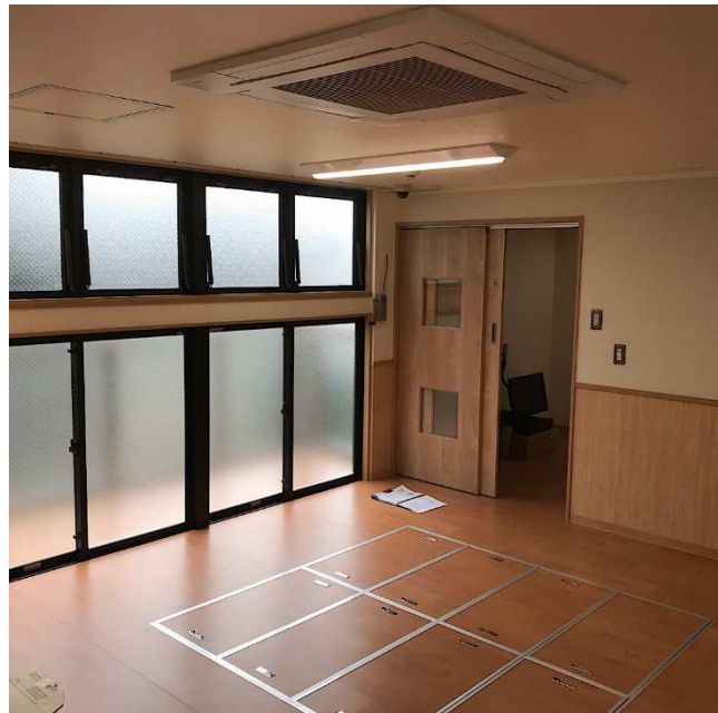
⑩保育室からバルコニー及び事務室兼医務室