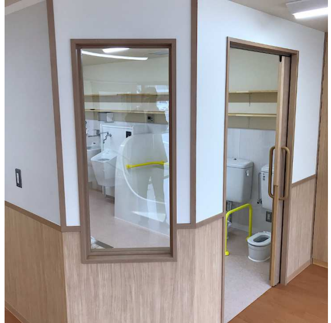
⑭保育室からトイレ入口