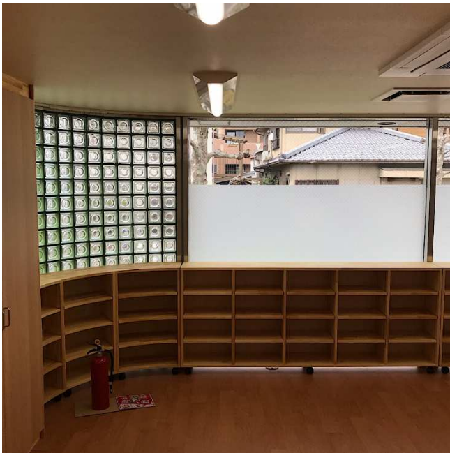
⑮トイレ入口から北側