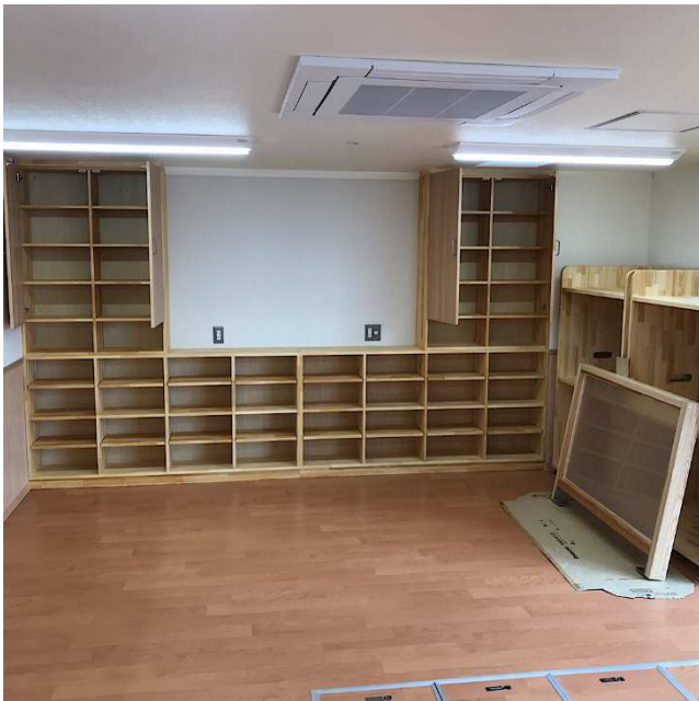
⑨乳児室 (乳児ベッド、畳ごぎ設置予定)