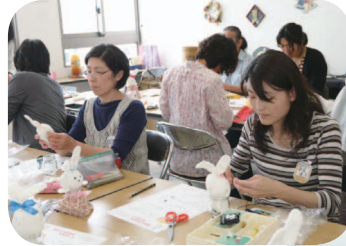
かわいいうさぎができますように...