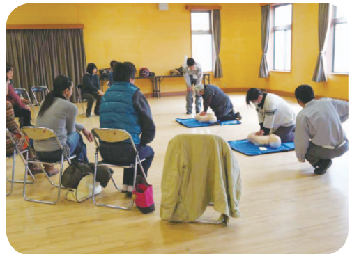
2月救命救急講習会 (フォローアップ研修)