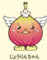
じょうりんちゃん