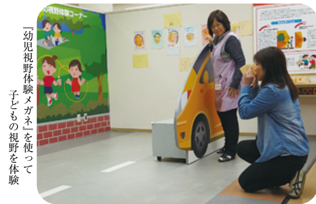
「幼児視野体験メガネ」を使って 子どもの視野を体験