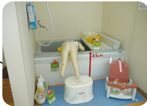
1～4歳児の事故死亡の約3割が溺水によるものです

一般家庭を再現したセーフティハウスで、危険な場所・物を学び、事故を防ぐ具体的な方法を解説していただきました。