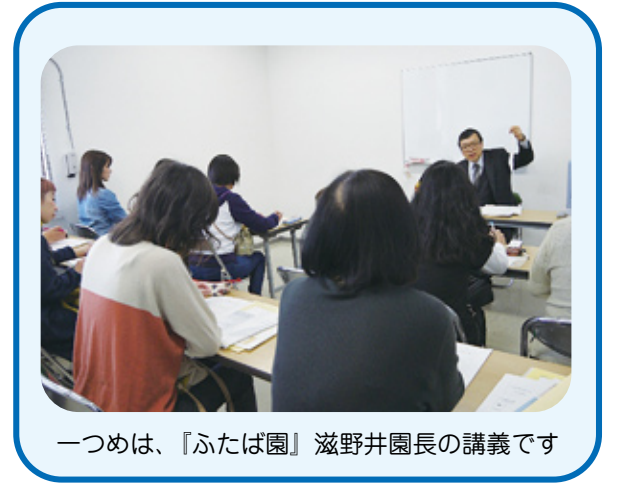
一つめは、『ふたば園』滋野井園長の講義です