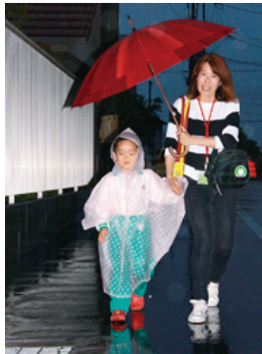
▲突然の雨です!! 「かさ もってきてるかな」