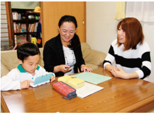
▲「今日は、ありがとうございました。」(左から)