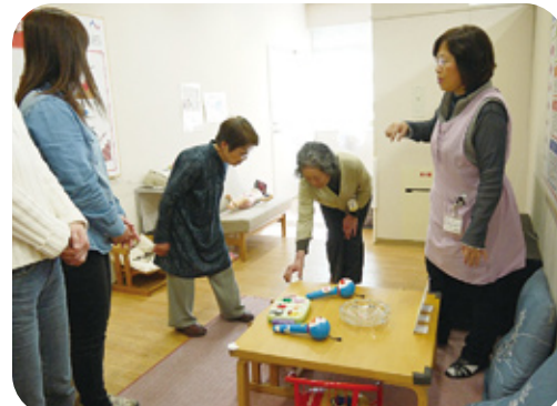
多くの時間を過ごす居間では、転倒・衝突・誤飲・熱傷などあらゆる事故が発生しています テーブルには、コーナークッションがあれば安心ですね