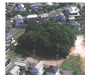
上空から見た丸塚古墳

5世紀前半に築造された全長104mの前方部が短い帆立貝形前方後円墳です。前方部から大型の家形埴輪が出土しています。久津川車塚古墳の被葬者の地域支配を支えた有力者の墓と考えられます。