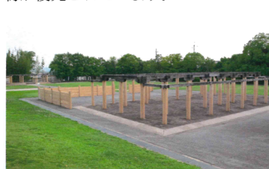
現在の正道官衙遺跡

現在は、史跡公園として整備されており、庁屋・副屋・南門などの中心建物が復元されています。