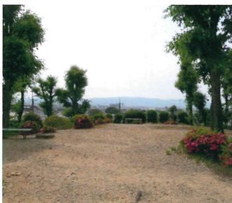
現在の下大谷1号墳