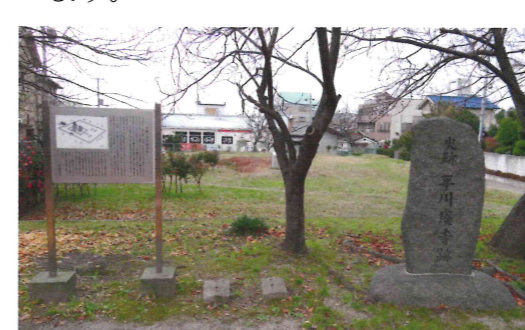
現在の平川廃寺跡