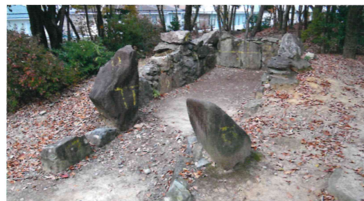
移築した上大谷17号墳の石室