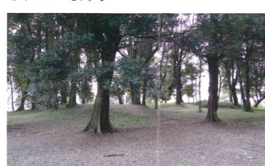
現在の久世廃寺跡 (左が塔基壇跡、右が金堂基壇跡)