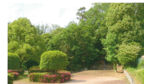
現在の尼塚6・7号墳