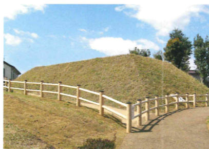
現在の芝ヶ原古墳