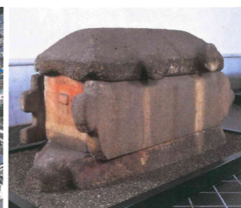
長持形石棺 (京都大学総合博物館所蔵)