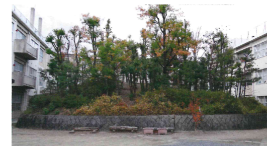
現在の芝ヶ原9号墳 (久世小学校内) ※平日の校内への立入はご遠慮ください。