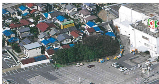
上空から見た青塚古墳

5世紀中頃に築造された一辺35m以上の方墳です。芭蕉塚古墳の被葬者の地域支配を支えた有力者の墓と考えられます。現在は、墳丘の一部が保存されています。