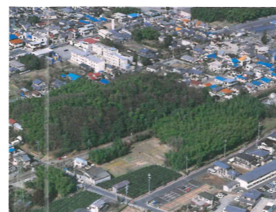
上空から見た久津川車塚古墳

5世紀前半に築造された全長272mの山城地域最大の前方後円墳です。埋葬施設の長持形石棺からは、鏡や甲冑など多くの副葬品が出土しています。南山城地域を支配した有力者の墓と考えられます。