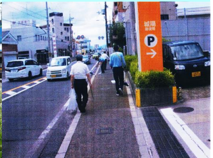
日本郵便 城陽郵便局