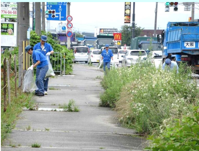
星和電機 株式会社