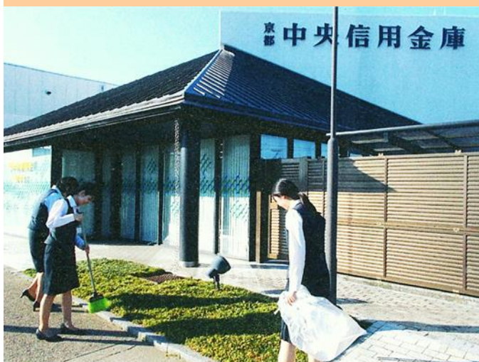
京都中央信用金庫 城陽支店