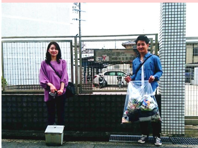
京都銀行 城陽支店