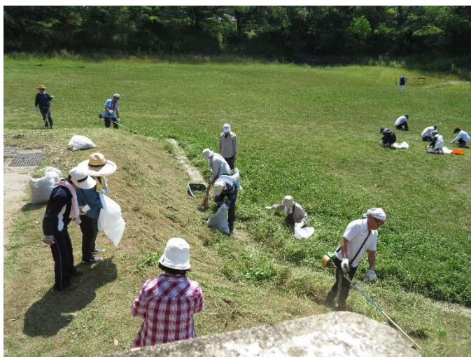
東部コミュニティセンター