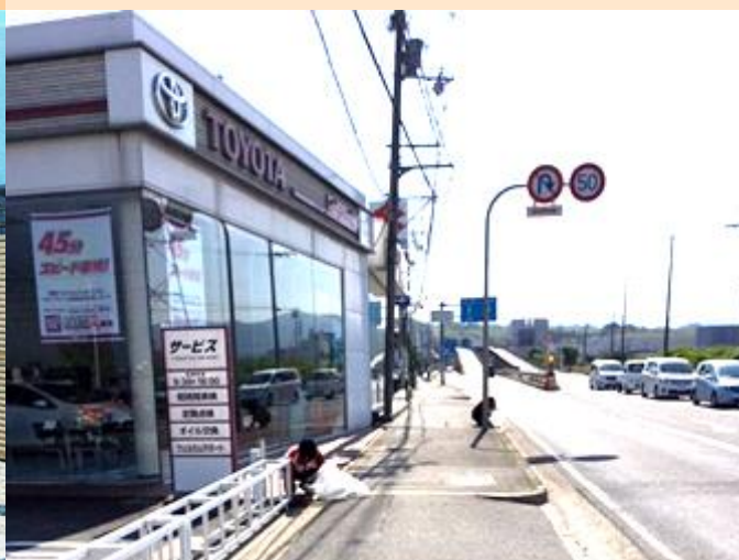
京都トヨタ自動車 城陽店