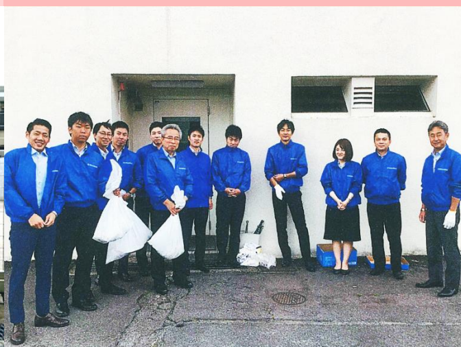
京都信用金庫 城陽支店