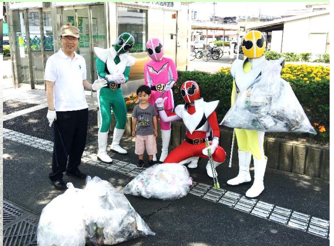
城陽スマイル (ゴリゴリ戦隊 五里ンジャー)