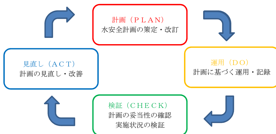
<水安全計画のPDCAサイクル>