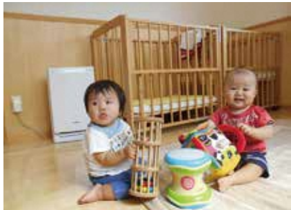
★0歳児交流室 授乳室

♥まめに、おもちゃの消毒をしてもらるので、安心して遊べます ♥城陽に引っ越してきました。こんなすてきな施設があって、よかったです。子育て世代にも優しい「ひなたぼっこ」です (プレイルーム利用の保護者)