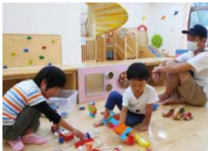
★プレイルーム(おもちゃあそび)