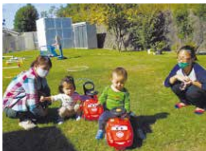
★交流広場(ひなたぼっこオープンデー～市民開放日～)

私たちは「ひなたぼっこ」の多目的ホールで、健康にとっても良いといわれている太極拳を、水曜日の午後、この日を心待ちにして仲間とともに楽しみながら練習に励んでいます。「ひなたぼっこ」は天井が高く、窓も大きく広々とした気持ちの良い建物です。何よりも職員のみなさんの笑顔が素敵で、地域の方との交流の場として利用しています。 (友が丘太極拳サークル)