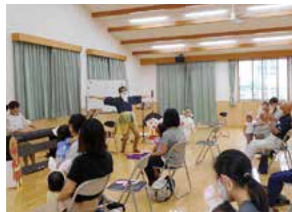
★多目的ホールでの多世代交流事業(楽しい健康音楽会)