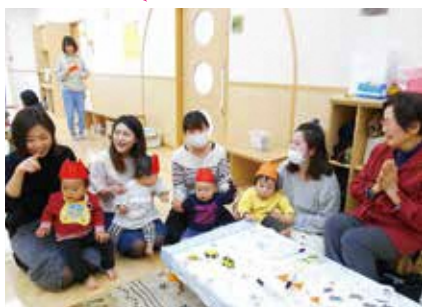
★プレイルーム(1月開催の折り紙あそび)

私たちは「ひなたぼっこ」の多目的ホールで、健康にとっても良いといわれている太極拳を、水曜日の午後、この日を心待ちにして仲間とともに楽しみながら練習に励んでいます。「ひなたぼっこ」は天井が高く、窓も大きく広々とした気持ちの良い建物です。何よりも職員のみなさんの笑顔が素敵で、地域の方との交流の場として利用しています。 (友が丘太極拳サークル)