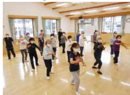
★多目的ホールの貸室