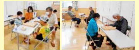
【今からはじめる囲碁・将棋のつどい】