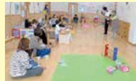
【絵本の読み聞かせ】