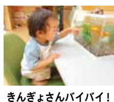
きんぎょさんバイバイ!