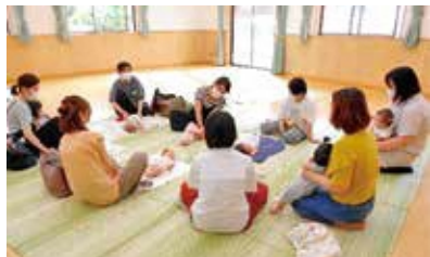
【ベビーマッサージ】