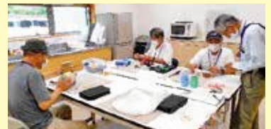
【城陽おもちゃ病院】