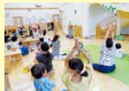
【親子で楽しむハッピーヨガ】