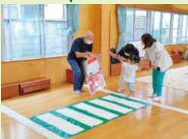
【富野幼稚園あそびのひろば】