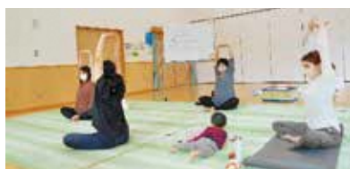
【妊婦さんあつまれ!】

妊娠生活を健やかに過ごし、安心して出産を迎え、楽しく子育てができるように、不安や悩みにお答えします。