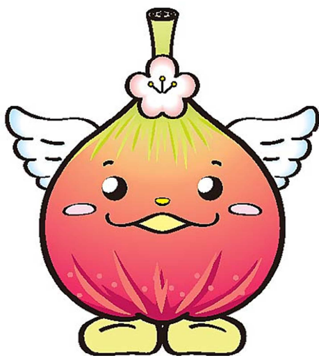
じょうりんちゃん