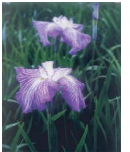
市の花（花しょうぶ）