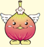
じょうりんちゃん