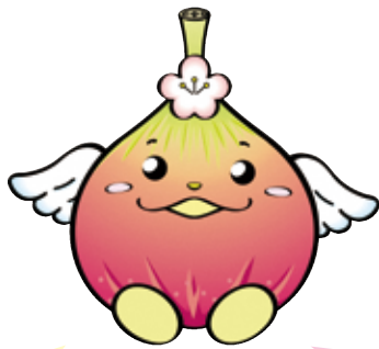
じょうりんちゃん

ジェネリック医薬品(後発医薬品)は、効き目や安全性が実証されている薬(先発医薬品)と主成分が同一であることなどが審査され、国から製造・販売が承認された安価な薬です。ジェネリック医薬品に切り替えることで、窓口負担が軽減できます。市では、ジェネリック医薬品に切り替えた場合に薬の負担額を低減できる可能性のある国保加入者に、差額通知を送付しています。※薬代が下がっても、処方せん料などの有無により、支払金額が差額通知どおりに下がらない場合があります。※切り替えについては、かかりつけの医師・薬剤師にご相談ください