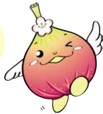
じょうりんちゃん