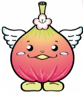
じょうりんちゃん

団体コード「joyokokuho22」が入力された状態でダウンロードできません。アプリがダウンロード済みの場合は、団体登録画面が表示されます