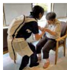
パワーアシストスーツを利用した介護

利用者の安全と快適さを保ちながら職員の負担を減らすため、DX(デジタル技術活用による業務改善)を推進しました。紙での事務処理をなくし、睡眠時の異変を知らせるシステムや介護を助けるパワーアシストスーツなども導入しています。残業はほとんどなく、職員も夜勤の負担が軽くなったと好評です。